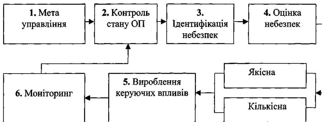
Рисунок 2 – Алгоритм управління охороною праці

Якщо в складові алгоритму, наведеного на рис. 1, вкласти параметри, що мають відношення до працезахоронної діяльності, то алгоритм методу управління охороною праці у загальному вигляді буде наступним: