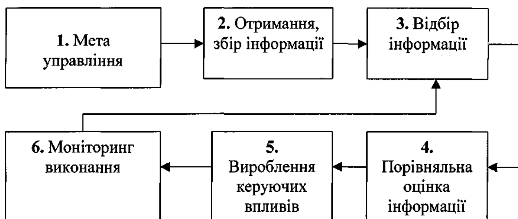
Рисунок 1 – Алгоритм управління процесом у загальному вигляді

Зміст складових алгоритму такий, що потребує деяких пояснень.